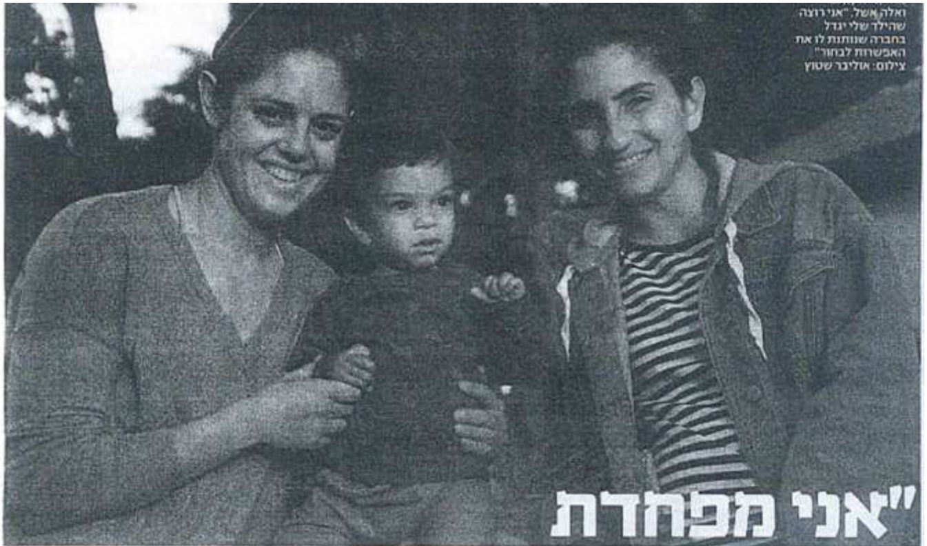
ואלה אשל "אני רוצה שהילד שלי יגדל בחברה שוותת לו את האפשרות לבחור"