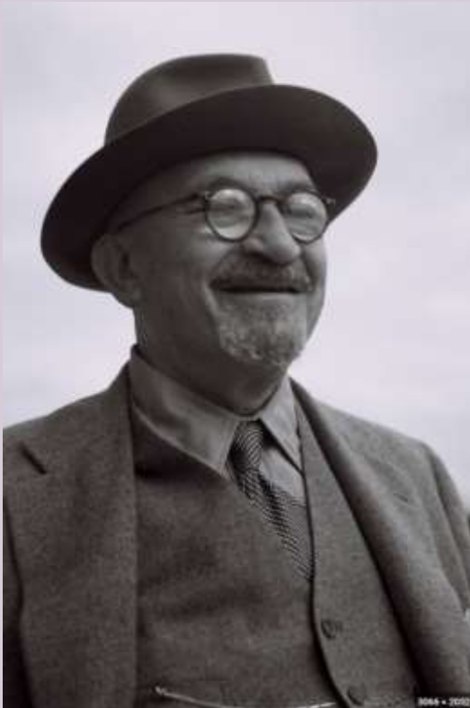
המשך בעמוד הבא