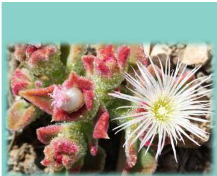
אהל הגבישים אשר בסכנת הכחדה