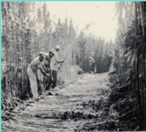
איור 1 : קציר הקנבוס בקיבוץ דפנה

הגידול העצום בצריכה הביא את האחים להחלטה לנסות להעביר את גידול צמח הקנבוס לארץ ולהוזיל בכך את עלויות היבוא. בספטמבר 1941 פנתה החברה לקיבוץ דפנה בהצעה להחכיר מהם שטח של 120 דונם לגידול קנבוס. תמורת ההחכרה הציעו לשלם לא"י לדונם