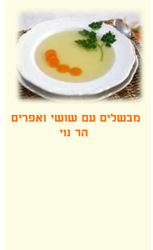
מבשלים עם שושי ואפרים הר נוי