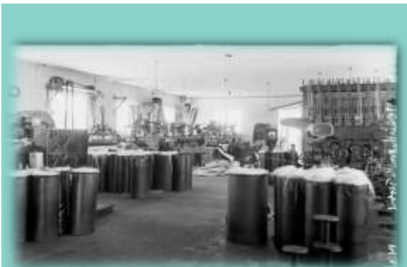
אולם היצור של האחים ירושלמי ברמת גן 1938.