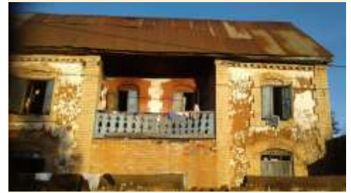
בית מבוץ וביצים- מדגסקר