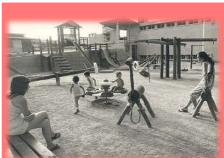
מגרש המשחקים הישן ברחבה האחורית של הכל בו היום

הצלחנו במשך שנים להקים חברה מיוחדת ובריאה, מלאת תוכן שבמבט עכשווי, לא קל למצוא ייחודיות שכזאת.