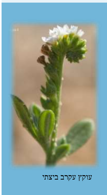
עוקץ עקרב ביצתי

וקטנה אחרונה חביבה – בגן המקלט פורחים נכון להיום בן חילף הביצות, ישרוע מאוגד, עוקץ עקרב ביצתי, ונרקיס סתוי. העלים של איריסי הארגמן כבר הציצו, ונקווה לפריחתם המרהיבה כרגיל לקראת סוף פברואר.