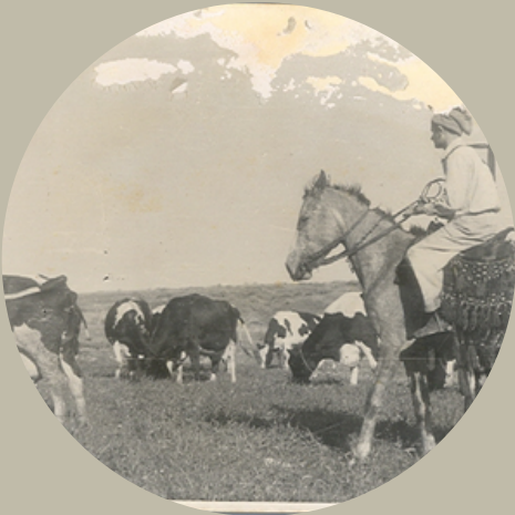
שבתאי אבני בעלי קאסם.

ספר לי קצת על הילדות שלך, איך הגעת לציונות ועל התהליך שהוביל אותך לעלות לארץ