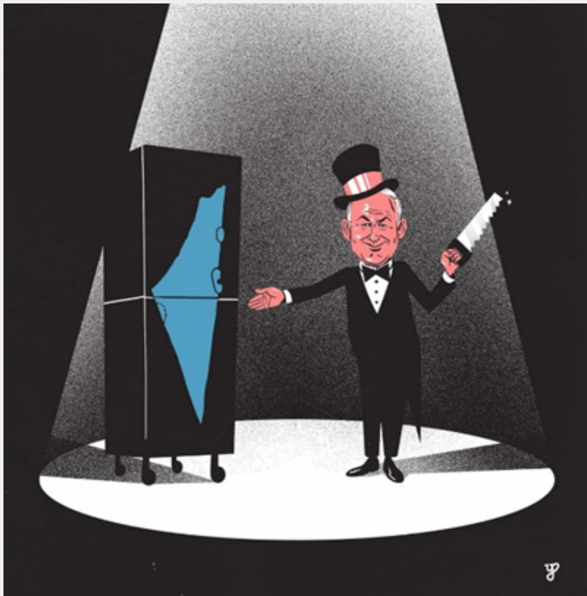
הוא קורע את המדינה. איור: יונתן פופר

הם מתגייסים לדבר גדול בהרבה. כי אנחנו חייבים את זה לעצמנו, לילדנו, לוותיקים שלנו, שעזבו הכל כדי לבנות כאן מדינה דמוקרטית, יהודית וליברלית.