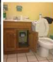
תכנון של חדרי שירותים