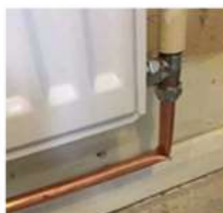
תשומת לב לפרטים