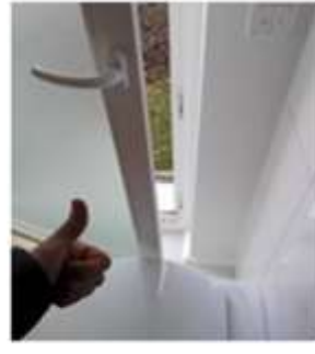
ניצול נכון של המקום