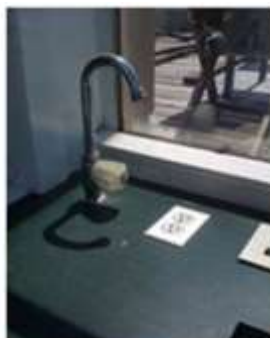
התאמת ברז לכיור. לפעמים זה לא כל כך פשוט