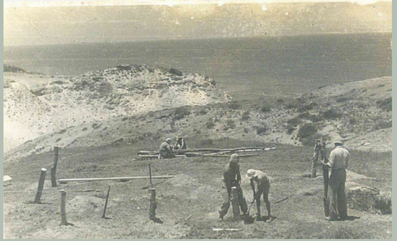
מכינים את המקום לטקס