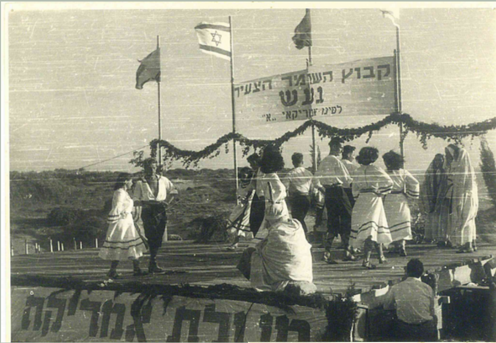
מפזים על הבמה