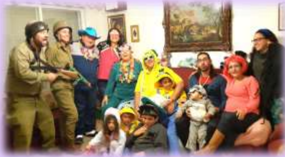
שבט רובינסקי פורים געש

כל החיים שלך מבוססים על נתינה ודאגה לאחר. למשפחה, לחברים, לשכנים ולילדים. כל מי שהכיר אותך, זוכר שאת פשוט בן אדם שכולו טוב.