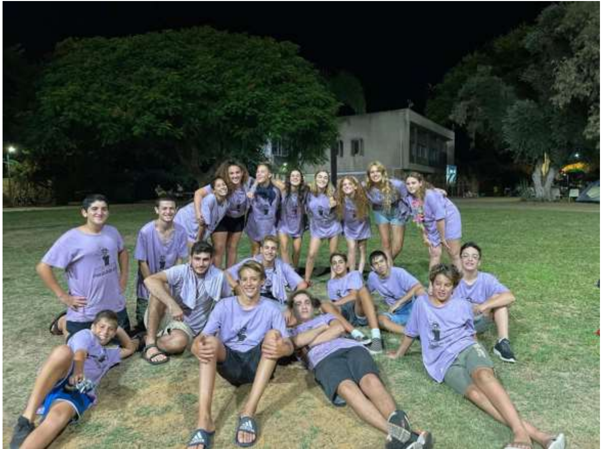
הנערים בפסטיבל האוכל 2021!